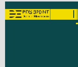
PDS 320 NT