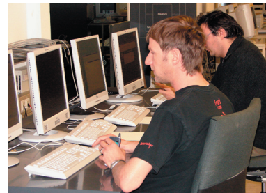
Persönliche und schnelle Hilfe durch den Dorner-Support.