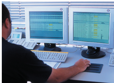
Übersichtliche Visualisierungen garantieren höchsten Bedienkomfort.