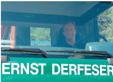
Automatische Fuhrparksteuerung und Planung für zielgerechte Auslieferung.