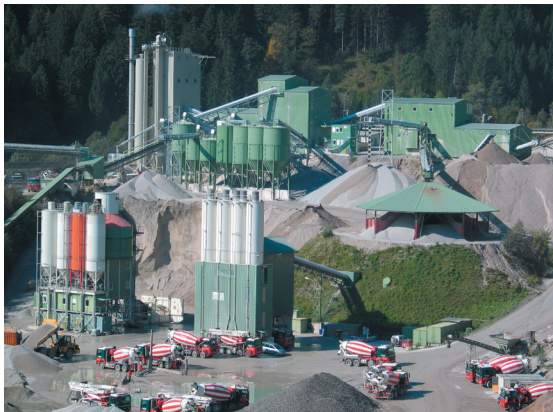
Perfekter Service und ausgereifte, anwenderoptimierte Soft- und Hardwarelösungen empfehlen Dorner Electronic als kompetenten Partner für die Baustoffindustrie

Transporte, Container, Erdbau, Transportbeton, Sand-Splitt-Schotter, Recycling & Entsorgung, Straßendienst